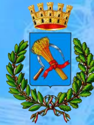
Azzano Decimo Fontanafredda Vigonovo