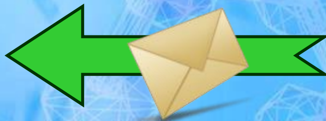
Biglietto di Cancelleria