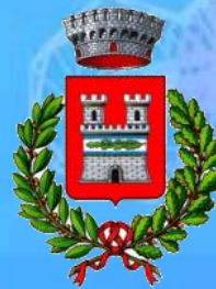
San Vito al Tagliamento